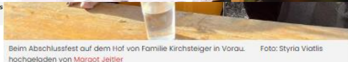
Beim Abschlussfest auf dem Hof von Familie Kirchsteiger in Voralpe.